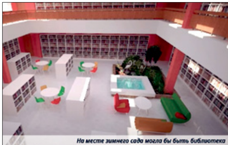
На месте зимнего сада могла бы быть библиотека

Я предложила сделать это на Вильтес, 3, и организаторы из