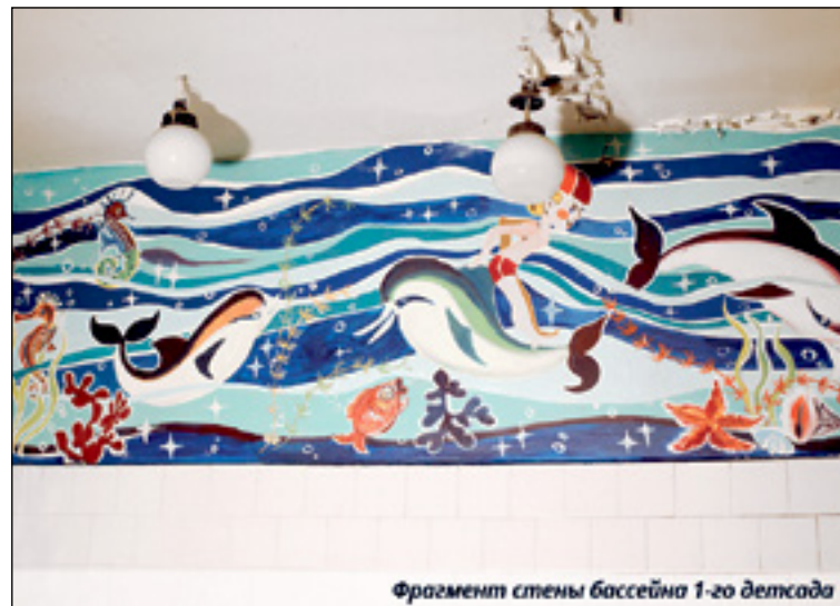
Фрагмент стены бассейна 1-го детского сада

Впрочем, ручаться за точность содержания письма Оксана не берет – никто из общественности этого письма не видел. «В ЦКН нам сказали, что подписи поставили работники культуры, но не уточнили, что знают эти работники культуры о здании первого детского сада. Аргументы в отказе дальнейшей оценки здания: ваших подписей 100, но от работников культуры мы получили – 200».