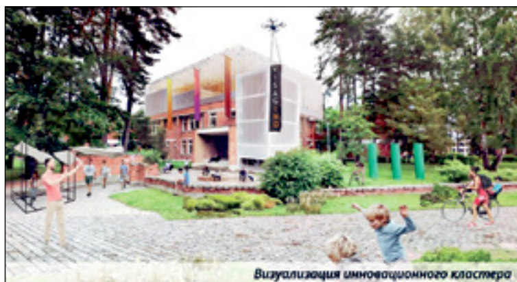
Визуализация инновационного кластера

группы, созданные по распоряжению мэра, представители общественности и эксперты разрабатывали проекты, которые должны способствовать развитию Висагинеаса.