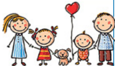
График приема жителей в ИЮЛЕ

На протяжении всего проекта предлагаются и оказываются комплексные услуги, предоставляемые семьям и каждому нуждающемуся в них жителю Висагинеаса.