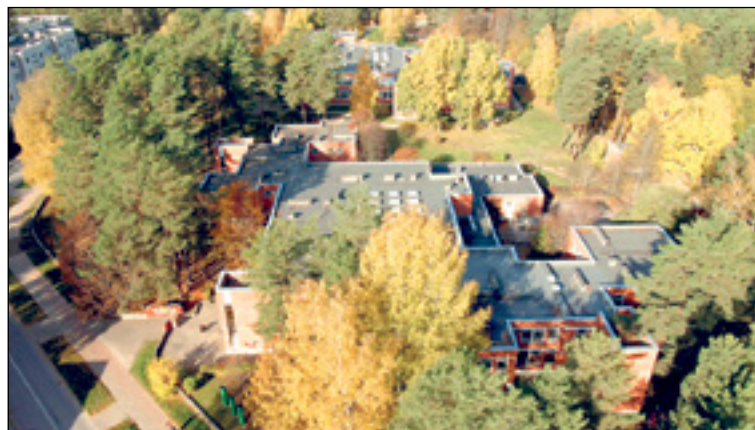
В последние дни на арену общественного обсуждения вновь вышла тема сноса/сохранения здания первого детского сада.

Это особенный объект, поскольку в спорах о его сносе или сохранении как фокусе сошлось множество аспектов, касающихся архитектурного облика города и создания новых инновационных структур, призванных обновить общественное пространство Висагинаса, сделав его современным и технологичным.