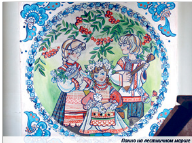
Панно на лестничном марше

«Наша цель – обратить внимание настоящих специалистов на здание по Вильтес, 3. Описание этого здания уже вошло в ряд изданий, в т. ч. и по архитектуре. У нас есть письма от специалистов, подтверждающих, что это здание уникальное. Его проект был создан только для нашего города (детсад № 1 и детсад № 3) и больше нигде он не был реализован. Другие городские детские сады были построены по другим проектам».