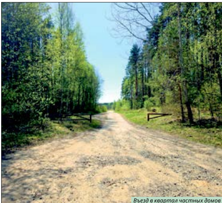
Въезд в квартал частных домов

Мнение редакции может не совпадать с мнением автора. Стиль и орфография автора статьи сохранены.