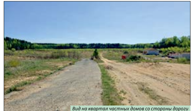
Вид на квартал частных домов со стороны дороги

По сути «убило надежду» заявление мэра и Министерства путей сообщения, что проектирование аварийной дороги на выезде от заправки Alauša намечено не в этом году, а только на 2027 год (!?), а реконструкция в 2028-2029 году (!?), т.е., когда каденция нынешнего мэра закончится, как и действующего министра. Если мы в этом году не могли ездить зимой (ломались машины, вылетали стёкла у общественного транспорта и не помогало ограничение скорости),