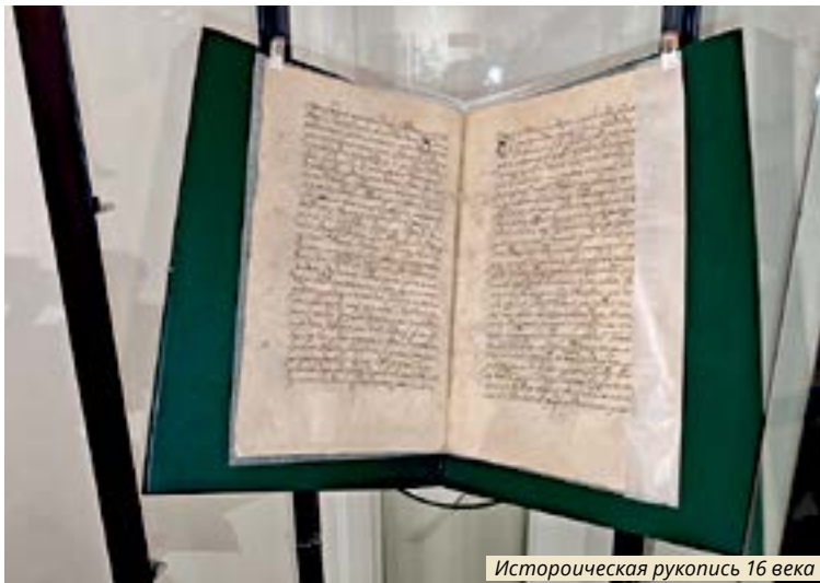
Историческая рукопись 16 века

14 апреля в Висагинском городском музее состоялось особое событие – мероприятие, посвящённое 500-летию первого письменного упоминания названия «Висагинас». Эта дата открывает новую страницу в осмыслении истории города, которая, как оказалось, уходит далеко вглубь веков.