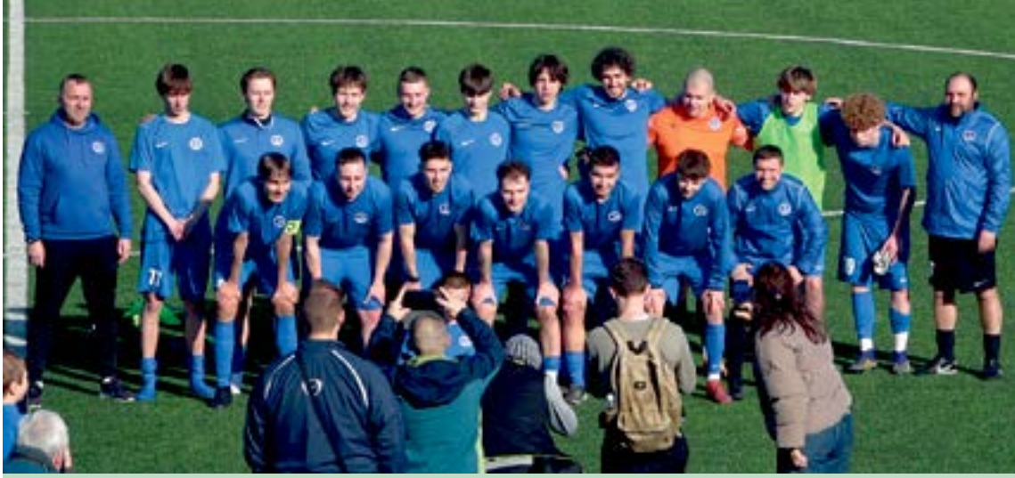
Užsakymo Nr. 5699

Приходите поддержать команду, которая возвращает футбольный дух в Висагинас.