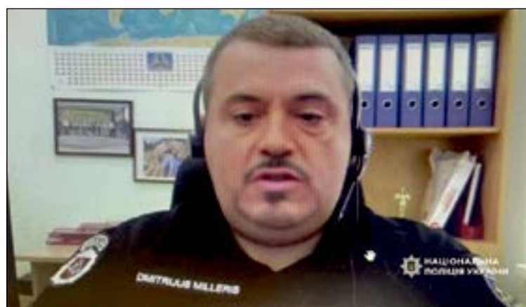
Мошенник представлявший сотрудником литовской полиции

Для обеспечения гладкого и эффективного сотрудничества была создана совместная следственная группа под эгидой Eurojust. Власти трижды встречались в штаб-квартире агентства в Гааге, чтобы обмениваться информацией и планировать действия по ликвидации колл-центров на Украине. Финансовая поддержка Eurojust позволила представителям Чехии, Латвии и Литвы присоединиться к дню операции на Украине и работать вместе с украинскими коллегами.