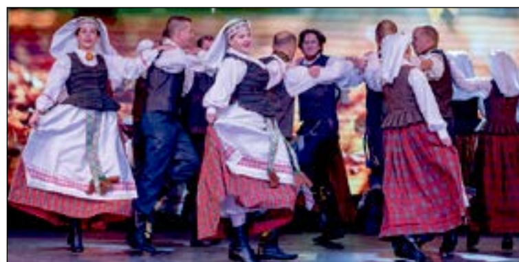
Užsakymo Nr. 5401