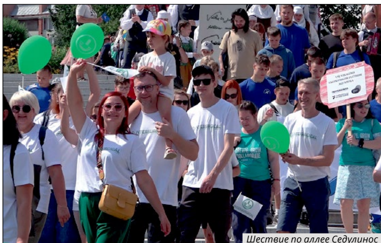
Шествие по аллее Седулинос

«Что можно себе позволить, если тебе 50?», – такой вопрос организаторов юбилейных торжеств не заставил долго ждать ответа. Уже с первых праздничных мероприятий стало ясно, что Висагинас может позволить себе очень многое и город сделал это, отпраздновав свой первый значимый юбилей с большим размахом.