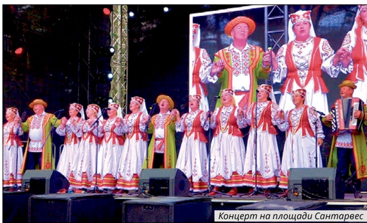
Концерт на площади Сантарвес

шествия по улицам города, в котором приняли участие почти 100 человек с недугом из разных городов Литвы и из Даугавпилса. Триатлонисты из разных уголков Литвы провели свои соревнования в окрестностях Белого озера, и в этом году они совпали с 50-летием Висагинаса.