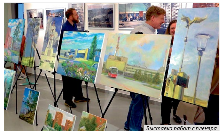
Выставка работ с пленэра

Без спорта не обходится ни один День города, и свои соревнования традиционно проводит Висагинский клуб людей с недугом «Visaggalis». Но в этот юбилейный год «Visaggalis» впервые начал свои соревнования с грандиозного