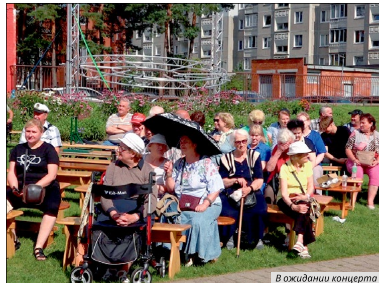
В ожидании концерта

В своей речи на торжественном заседании Висагинского совета