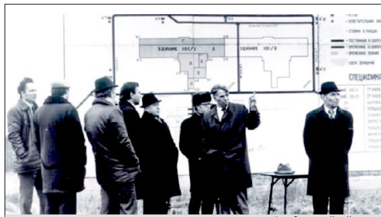
Середа – крайний слева

Параллельно продолжалось и строительство города, и бережное отношение к окружающей природе сделало Висагинас особенным: во многих местах