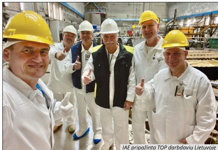
IAE pripažinta TOP darbdaviu Lietuvoje

– Esamiems darbuotojams – toliau tikėti savo jėgomis ir drąsiai kelti karteles. Jūs jau įrodėte, ką galime pasiekti kartu. O tiems, kurie svarsto – kviečiu nepraleisti progos prisidėti prie unikalaus projekto, kur darbas turi aiškią prasmę, o komanda – tikrą vertę. Ignalinos atominė elektrinė pripažinta vienu geriausių patraukliausių darbdavių Lietuvoje. Pelnėme pirmąją vietą „CV-online TOP darbdavys 2024“ viešojo sektoriaus kategorijoje ir devintąją visų Lietuvos TOP darbdavių sąrašė. Tai dar kartą patvirtina, kad IAE – vieta, kur galima ne tik augti profesiskai, bet ir būti reikšmingos misijos dalimi.