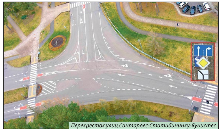
Перекресток улиц Сантарвес-Статибинку-Яунистес