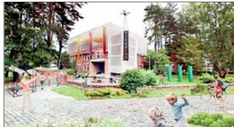
Визуализация BAU/LAND (2019 год) из сборника изучения возможностей развития Висагинаса