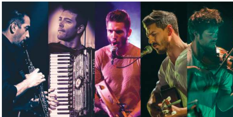
Уже 28 декабря Висагинас посетит известная группа из Италии «Domo Emigrantes».

Харизматичные исполнители обещают исключительный концерт, а чувственная, романтическая и многокрасочная концерт-