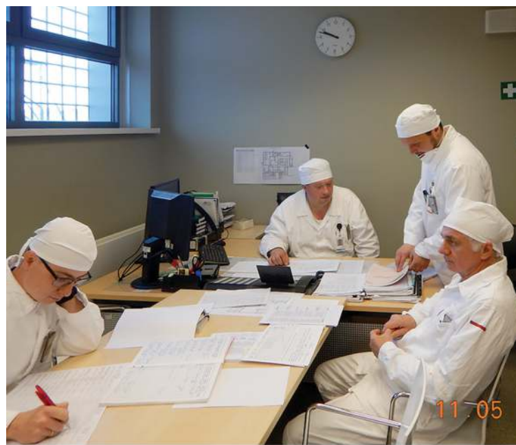
Персонал комплекса В3/4.

Мы готовы информировать общественность напрямую, без каких-либо посредников, и ждем со стороны самоуправления предложений о встречах с жителями. Можем рассказать и про отходы из Майшягалы, и ответить на любые вопросы общественности.