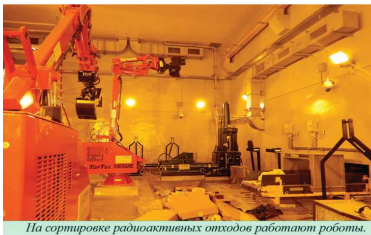
На сортировке радиоактивных отходов работают роботы.

Все об ИАЭС читайте на сайте https://www.iae.lt